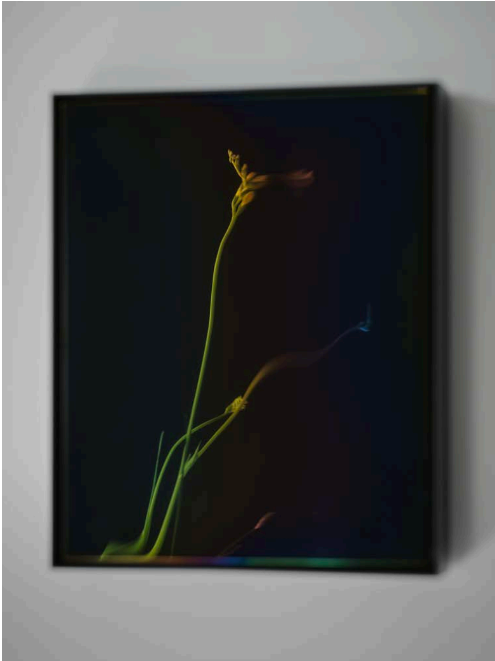
Teruhiro Yanagihara Studio : Studies on Black #0 Imperfection 274W x 334H x 50D mm, 1kg, stainless steel coil t=0.4mm and stainless steel

Title : Studies on Black (#0 Imperfection #1 Unprocessed #2 Concave #3 Convex #4 Bent #5 Struck) Designer : Teruhiro Yanagihara Studio