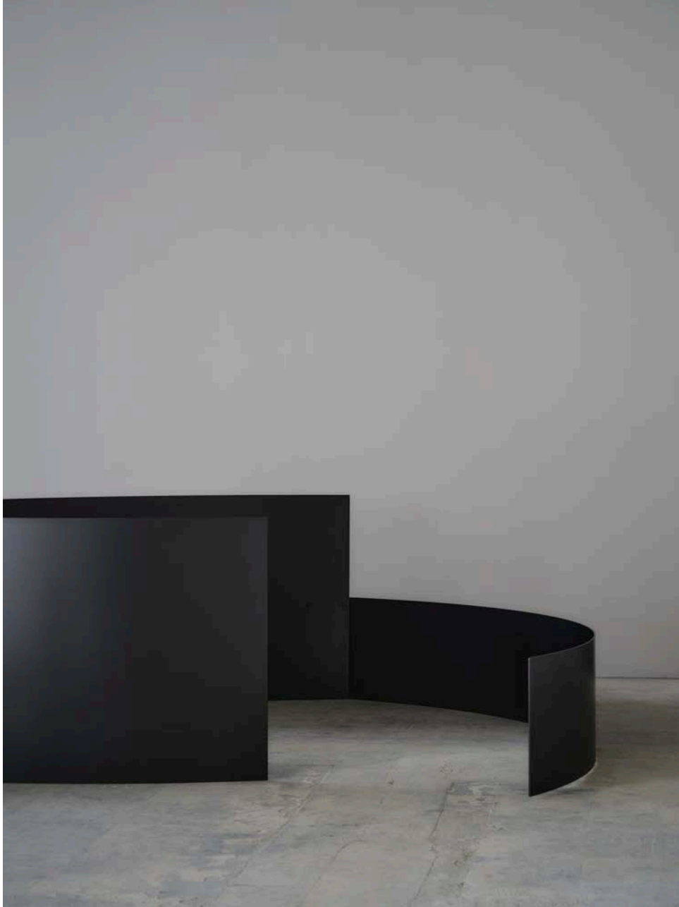
Fleur van Dodewaard : SCULPTURE B 2400W x 736H x 2000D mm, 120kg, stainless steel panel t=5mm / 2024